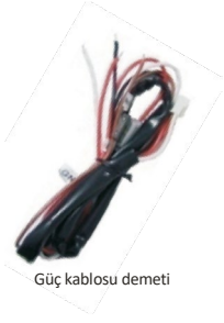
Güç kablosu demeti