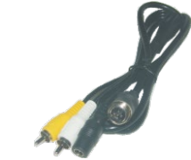
4PIN erkek-RCA + 4PIN erkek + DC Dişi